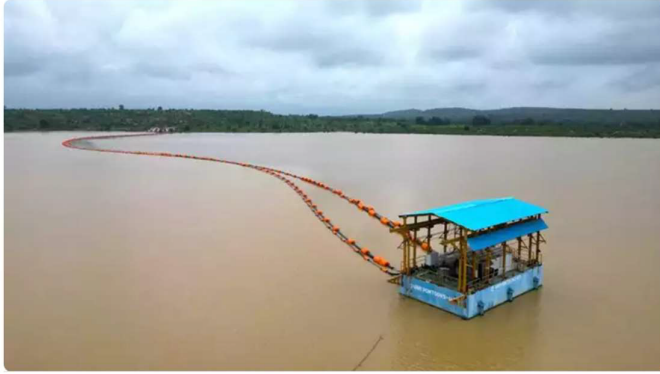
तैरता इंटेक वेल