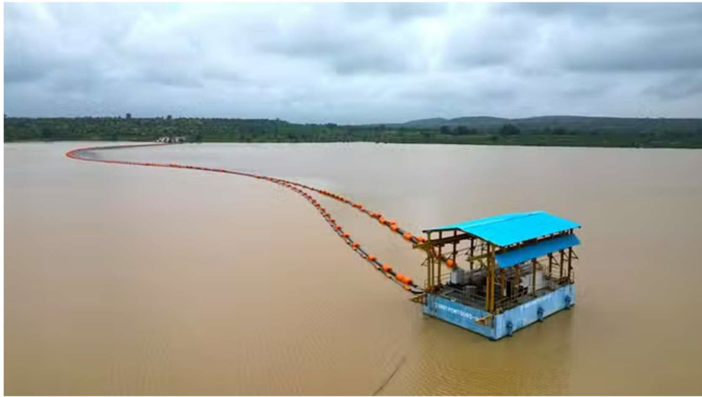
सोनभद्र के धंधरौल बांध में लगा इंटेक वेल।

Sonbhadra News: इस इंटेक से 205 गांवों के 23,779 ग्रामीण परिवारों को नल से स्वच्छ पेयजल की सप्लाई किया जाएगा। इंटेक से लिया जाने वाला रॉ-वाटर वाटर ट्रीटमेंट प्लांट पहुंचेगा और यहां से सात पानी टंकियों के माध्यम से पेयजल सप्लाई की जाएगी।