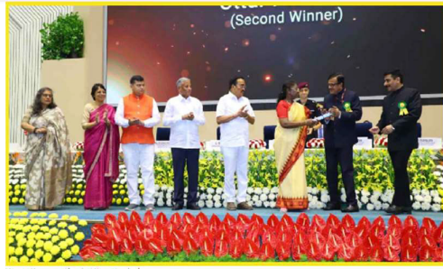
Water conservation in Uttar Pradesh

Published on: 22 Oct 2024 6:53 PM (Updated on: 22 Oct 2024 6:54 PM)