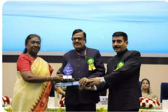
The National Water Awards started in 2018 to promote water conservation in line with the government's vision of a 'Jal Samridh Bharat' (water-sufficient India).

ET Online Desk • ETGovernment Updated On Oct 22, 2024 at 07:55 PM IST