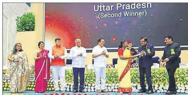
U.P. officials received the award from President Droupadi Murmu in New Delhi on Tuesday.