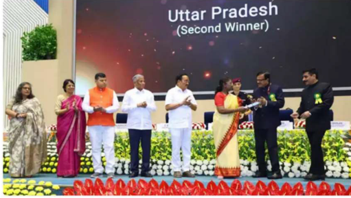
राष्ट्रीय जल अवार्ड