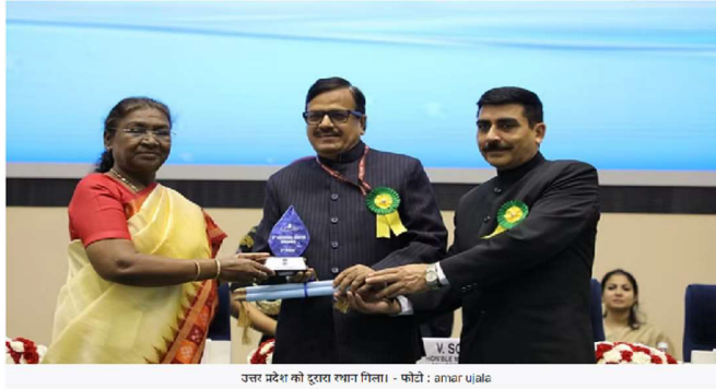
उत्तर प्रदेश को दूसरा स्थान मिला।