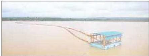
बांध पर तैरता इंटेक दिखाई देगा। इंटेक से जुड़े पाइपलाइन फ्लोटर पर बांध पर तैरते हुए वाटर ड्रीमेट प्लांट तक जाते हुए नजर आएंगे। इस तरह का नजारा आपके लिए सबसे अलग होगा। यह इंटेक 205 गांव के 23,779 ग्रामीण परिवारों को नल से स्वच्छ पेयजल की सपनाई करेगा। 1 लाख 30 हजार से अधिक ग्रामीण इसे योजना से लाभान्वित होंगे। इंटेक से सिलया जाने वाला रॉ-वाटर वाटर ड्रीमेट प्लांट पहुँचेगा और वहाँ से 7 पानी टैंकों के माध्यम से पेयजल सपनाई की जाएगी। योजना के तहत 5 सेडवुल्यूआर भी बनाए गये हैं।

हूर नमामें गंगे एवं ग्रामीण जलापूर्ति विभाग के अपर मुख्य सचिव अनुराग श्रीवास्तव को जानकारी दी गई। जिसके बाद उन्होंने इन नदी विधि से सोनभद्र में पेयजल की चुनौतियों से निपटने का निर्णय लिया और फ्लोटिंग इण्टेक सिस्टम का कार्य प्रारंभ किया गया। जनपद-सोनभद्र क्षेत्रफल को दृष्टि से यूपी का दूसरा सबसे बड़ा जिला है जो 4 राज्यों मध्य प्रदेश, झारखण्ड, छत्तीसगढ़ एवं बिहार से गिरा हुआ है।