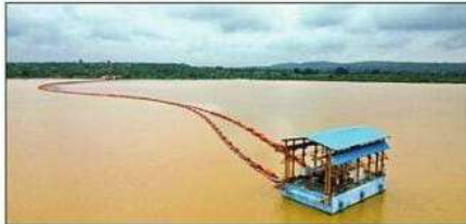
सोनभद्र के धंधरौल बांध में लगा इंटेक वेल। श्रेष्ठ जगद्वज पाठक

जल जीवन मिशन (हर घर जल) कार्यक्रम के तहत जनपद सोनभद्र में 12 ग्रामीण पड़प पेयजल योजनाओं का निर्माण विभिन्न फर्मों से कराया जा रहा है। योजनाओं में जल आहरण के लिए सोन नदी, रेणु