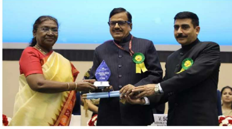
राष्ट्रपति द्रोपदी मुर्मू ने उत्तर प्रदेश के जल प्रबंधन और जल संरक्षण के क्षेत्र में उत्कृष्ट कार्य करने के लिए उत्तर प्रदेश को राष्ट्रीय जल पुरस्कार से नवाजा गया है।

UPDATED: TUE, 22 OCT 2024 06:42 PM (IST)